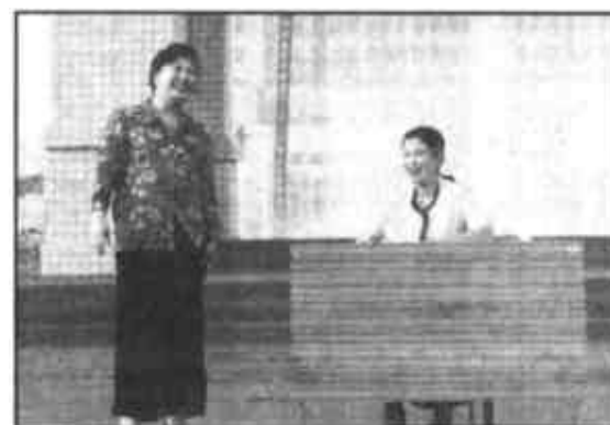
著名小品表演艺术家高秀敏表演的小品《求职》幽默风趣、引人发笑。