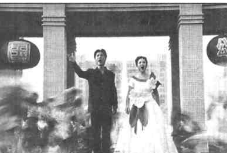
歌舞《胜利》动静结合，歌舞并茂，体现出油城人民从胜利走向胜利。