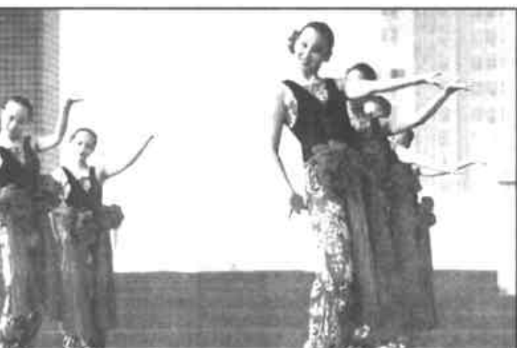
舞蹈《包楞调》把民族与现代舞蹈结合的天衣无缝，颇有韵味。