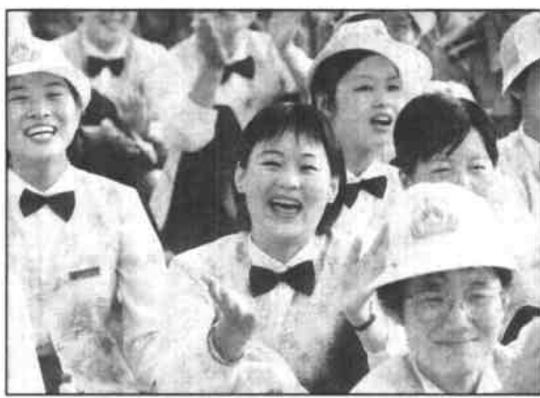
火热的场面，热烈的掌声，热情的观众对台上的演出，乐不可支。