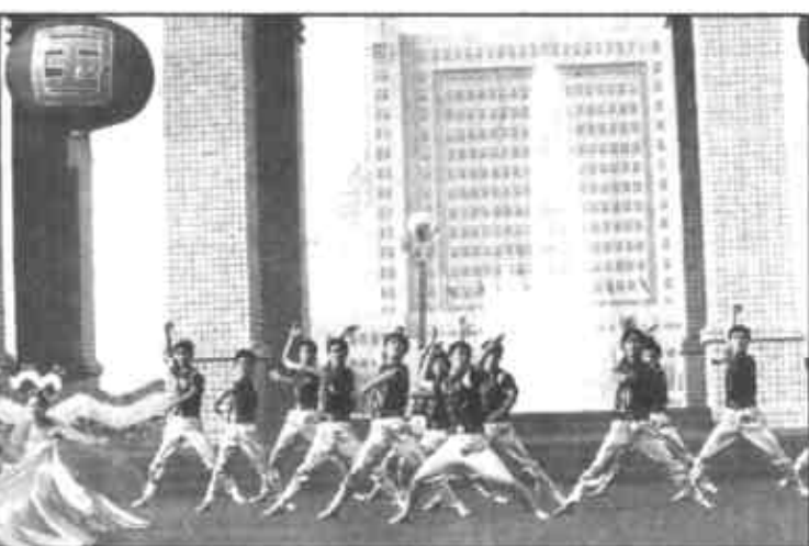
舞蹈《崛起》体现了中华民族不屈不挠、拼搏向上的顽强精神。