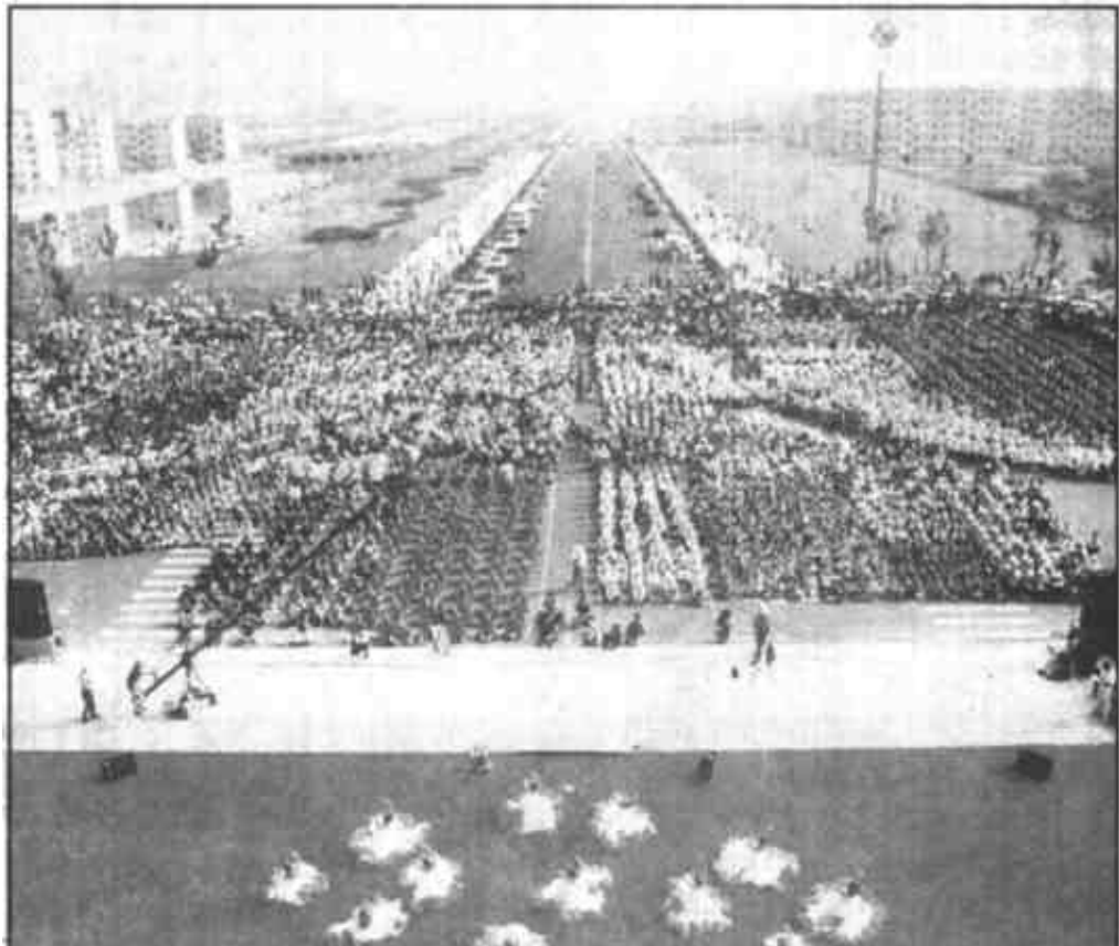
演出精彩纷呈，吸引了近万名观众。