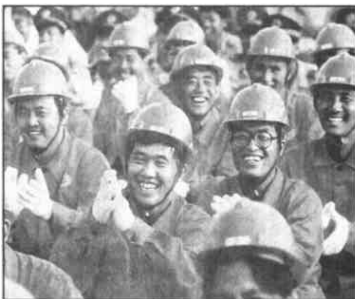
石油工人们发出阵阵喝彩。