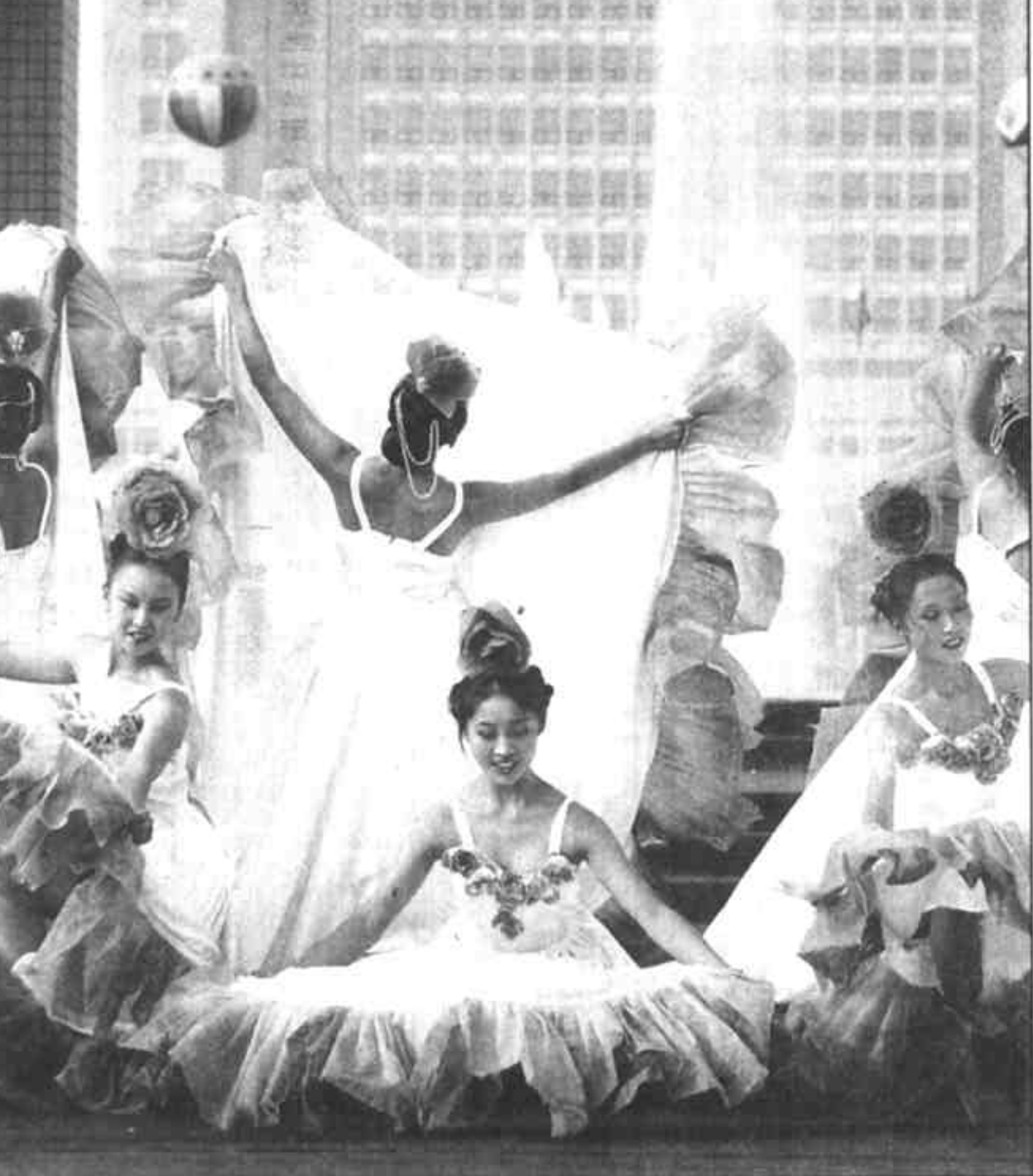
生活多幸福，人比花更美。济南市歌舞团表演的舞蹈《国色天香》把节目推向了高潮。